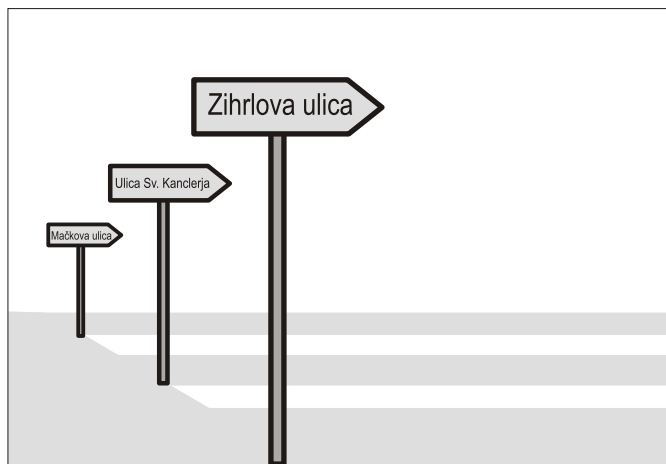
prvi predlog: ulični sistem