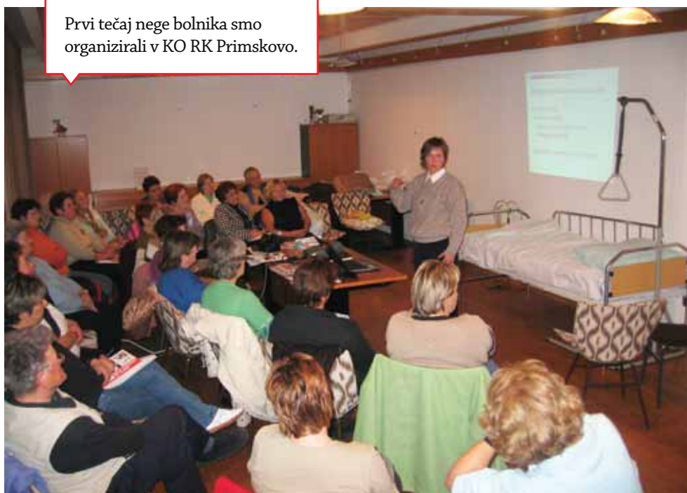
Prvi tečaj nege bolnika smo organizirali v KO RK Primskovo.

Ob 20. uri vabljeni na družabni ples! Plesali bodo plesni pari iz vse Slovenije ter pari iz Hrvaške in Bosne. Vredno ogleda! Vabljeni!